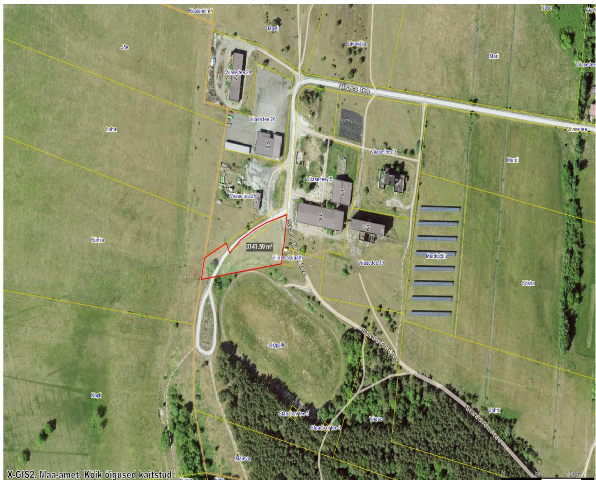
Joonis 1. Planeeringuala asendiskeem (Alus: Maa-ameti X-Gis kaardiserver)

Planeeringuala piirneb põhja suunal Viase tee 28 (katastritunnus 72101:002:0795) ja Viase tee katastriüksusega (katastritunnus 72101:002:0845), lõuna suunal Jalgpalli katastriüksusega (katastritunnus 72101:002:0844), ida suunal Viase tee 15 (katastritunnus 72101:002:0796) ja Viase alajaama katastriüksusega (katastritunnus 72101:002:0312) ning lääne suunal Künka katastriüksusega (katastritunnus 72101:002:0642) .